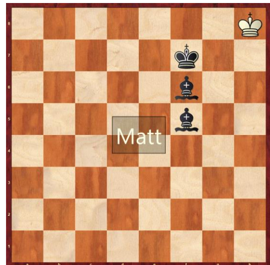
2. Lg5-f6# (Bild 3)